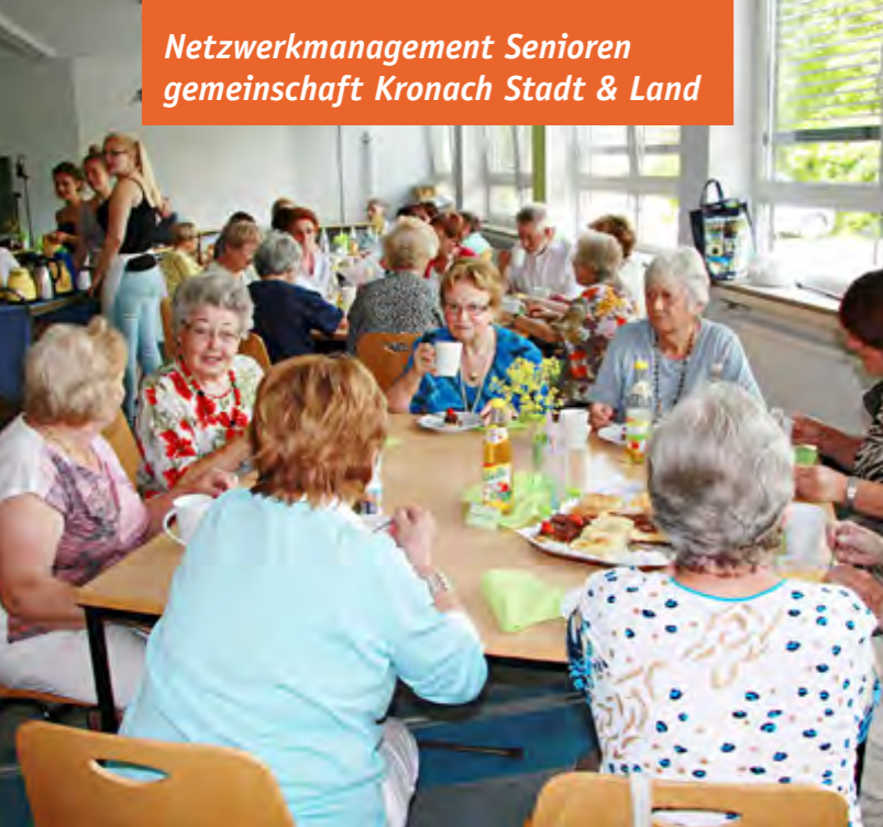
In fröhlicher Runde werden Problemlösungen diskutiert.