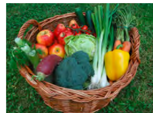
In der Kochschule wird Leckeres aus der Region verarbeitet.

Tier- und Umweltschutz. Wie Fleisch und Gemüse, Salat und Obst, Milch und Eier anschließend in ein wohlschmeckendes Gericht verwandelt werden können, das zeigen die Gastwirte aus dem Wittelsbacher Land ihren kleinen Gästen dann in der „Kinderkochschule“. Der Höhepunkt ist das anschließende gemeinsame Essen, bei dem all die leckeren Gerichte auch verspeist werden. So erleben die Kinder auf spielerische Weise, dass gesundes Essen viel besser schmeckt als Fastfood aus der Tüte und dass auch die Zubereitung schon viel Spaß machen kann.