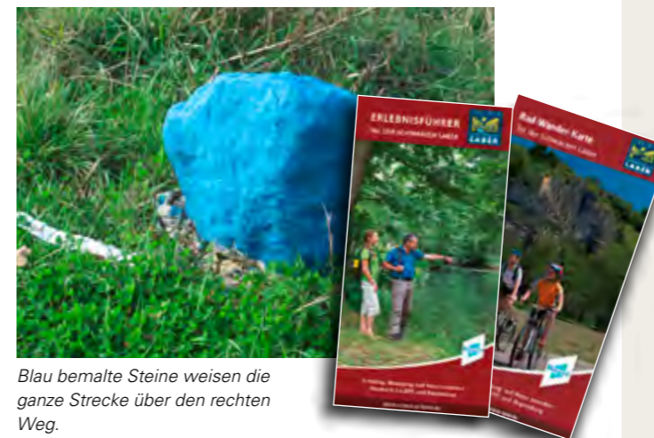
Blau bemalte Steine weisen die ganze Strecke über den rechten Weg.

Dabei muss der ebenfalls etablierte Projektmanager viele Einzelmaßnahmen im Auge behalten. Das reicht von Informationspavillons über die Unterstützung einzelner Gemeinden beim Bau von Rad- und Wanderwegen bis zu deren durchgängiger Beschilderung nach einheitlichen Normen des Bayernnetzes für Radler. Auch muss mit den Grundbesitzern die Wegeführung in