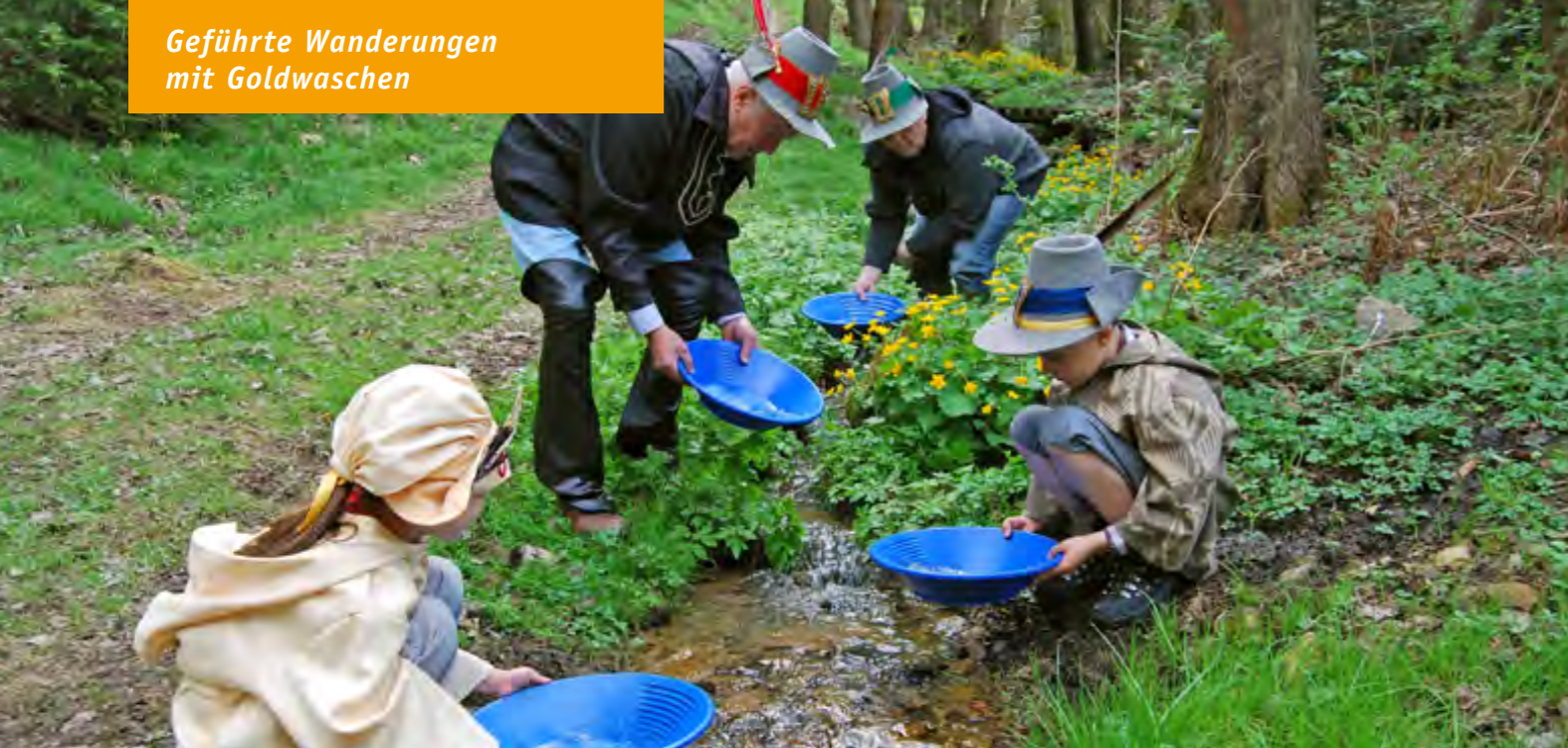
Was da gelb schimmert, das sind nur die Dotterblumen.