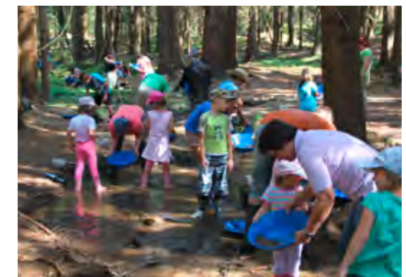
Spannend: Manchmal bleiben in den Pfannen kleine glänzende Brösel zurück!

Leistungen des Amtes für Ernährung, Landwirtschaft und Forsten Neumarkt i.d.Opf Beratung bei der Projektentwicklung und Konzeption, Förderabwicklung