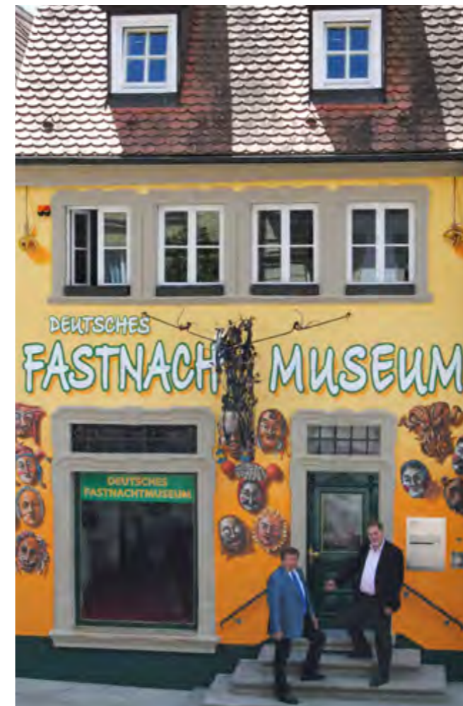
Das Deutsche Fastnachtsmuseum – ein Ort mit Augenzwinkern.