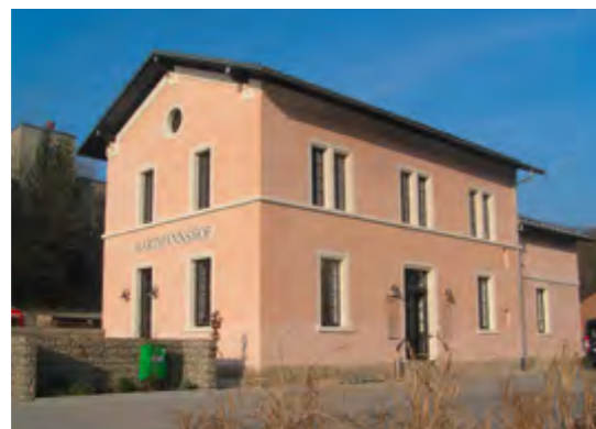
Der „Urzeitbahnhof“ Hartmannshof, 1858/59 vom renommierten Baumeister Bürklein geschaffen, strahlt in neuem Glanz.

Der kleine Bahnhof des Ortes Hartmannshof im Nürnberger Land darf im wahrsten Sinne des Wortes als „geschichtsträchtig“ gelten. Schon das schmucke, noch weitgehend im Originalzustand erhaltene Gebäude aus dem Jahre 1858 atmet Historie. Entworfen wurde es vom großen Baumeister Georg Friedrich Christian Bürklein (1813-1872), der neben vielen anderen Bahnhöfen auch den Münchner Hauptbahnhof sowie sämtliche Großbauten und Privathäuser an der Münchner Maximilianstraße, einschließlich des Maximilianeums, geplant hat. Dank der Förderung aus dem europäischen Leader-Programm zur Entwicklung des ländlichen Raumes konnte der Bahnhof nun zu einem veritablen Museum ausgebaut werden, das archäologische Funde aus der näheren Umgebung aufnimmt.