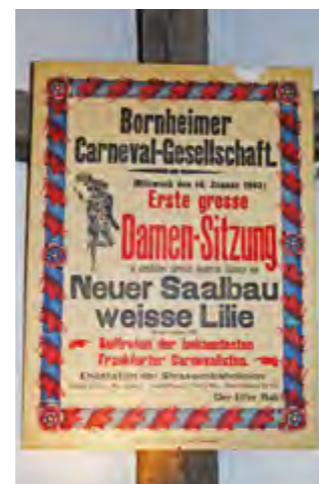
Das Museum beherbergt historische Plakate und eine der wohl weltweit größten Sammlungen von Orden und Plaketten.

Themen und Ausstellungsmaterial gibt es dafür reichlich. Karneval, Fasching, Fastnacht – das sind schließlich seit mehr als 700 Jahren feste Bestandteile der abendländischen Kultur. Dazu gehören Till Eulenspiegel ebenso wie der venezianische und der römische Karneval mitsamt ihren Einflüssen auf den rheinischen Karneval und den Münchner Fasching. In Franken ist das Highlight natürlich die jährliche Prunksitzung zu Veitshöchheim, womit auch der Bogen zur Entwicklung des politischen Karnevals gespannt ist. Dessen historische und aktuelle Hauptakteure werden im neuen Museum ebenfalls gezeigt – einschließlich mancher Ausschnitte aus den Reden.