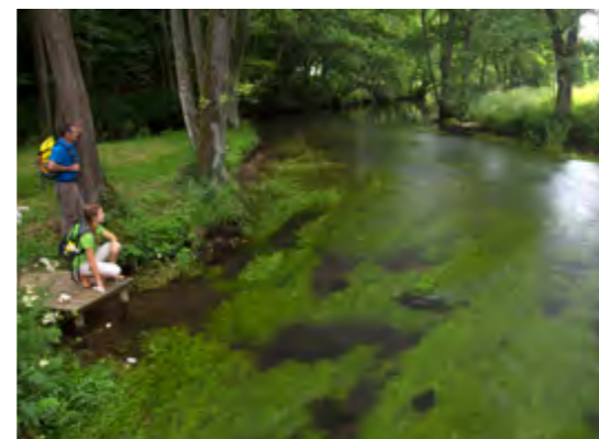
So malerisch kann Erholung sein: Schöne Ausblicke verzauern die Blicke der Wanderer.

Das Gewässer entspringt nahe der europäischen Hauptwasserscheide im Ort Laaber in der Nähe von Neumarkt i. d. Opf, wo sich die Fluss-Systeme von Atlantik und Mittelmeer trennen. Es sprudelt aus einer Karstquelle des Oberpfälzer Jura und schlängelt sich in unzähligen Windungen über etwa 75 Kilometer bis zur Donau hin, wo sie bei Sinzing mündet. Der Name kommt wohl daher, weil sie träge dahin fließt und das Wasser deshalb dunkel erscheint. An diesem Fluss mit den vielen alten Städtchen und Dörfern an seinen Ufern sollen sich nun vor allem Ausflügler und Urlauber tummeln. Die Fahrradtour im Tal der Schwarzen beginnt oder endet am Bahnhof in Neumarkt, gut 10 Kilometer von der Quelle entfernt. Daher ist die Länge der Tour rund 85 km.