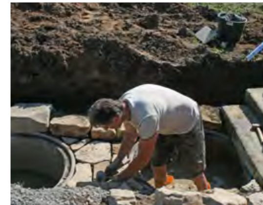
Hier wird gerade ein Feldbrunnen gebaut.

Das Projekt ist an drei Standorten mit jeweils einem Modul angesiedelt, in dem der lokale inhaltliche Schwerpunkt dargestellt wird. Jeder der drei teilnehmenden Gemeinden ist ein besonderes Thema zugewiesen, so dass in der Zusammenschau die Gesamtheit des Gartenbaus im Schweinfurter Mainbogen umfassend abgebildet wird. Dabei sollen aber natürlich auch die jeweiligen historischen und die aktuellen örtlichen landwirtschaftlichen Besonderheiten berücksichtigt werden. So ist etwa in Sennfeld der moderne Gemüseanbau angesiedelt, in Gochsheim hingegen der historische Gemüseanbau und in Schwebheim schließlich der moderne Kräuteranbau.