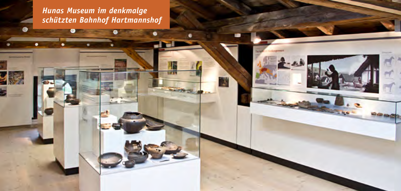
Im Dachgeschoss des Bahnhofs sind die Funde aus der archäologischen Kleinregion ausgestellt.