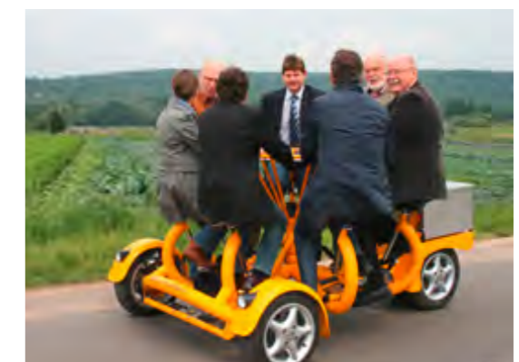
Gruppenerlebnis: Mit einem Mehrpersonenfahrrad können die einzelnen Stationen des Lehrpfades angefahren werden.

genheiten und Orientierungshilfen. Dazu kommen Lehrpfade und ein historischer Lehrgarten mit alten Gemüse- und Kräutersorten – und nicht zuletzt zwei vierrädrige Mehrpersonenfahrräder, mit dem kleine Gruppen die einzelnen Stationen besuchen können.