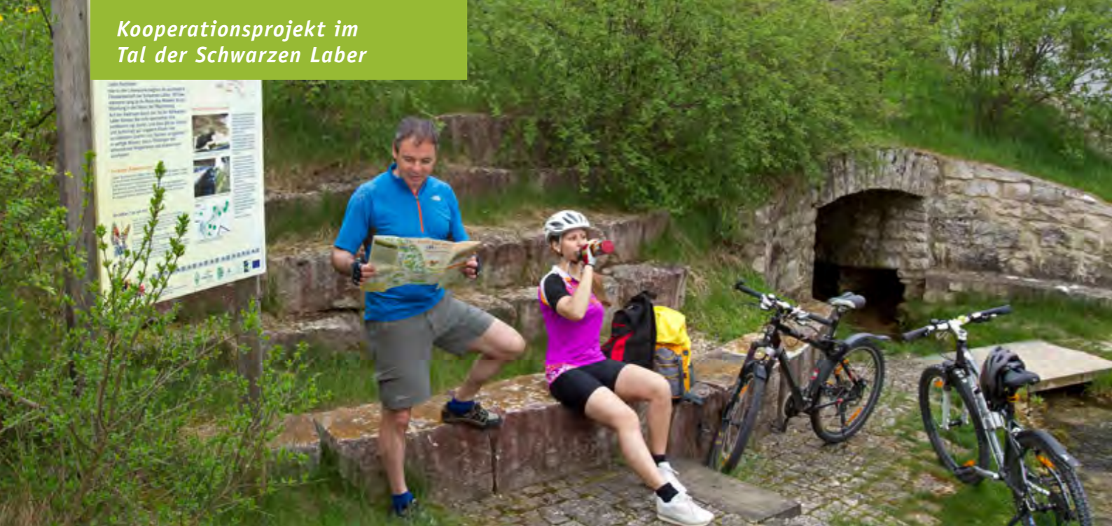
Radwandern liegt im Trend. Die neue Rad-Wander-Karte zeigt den Weg zu lohnenden Zielen entlang der Schwarzen Laber, hier die Quelle.