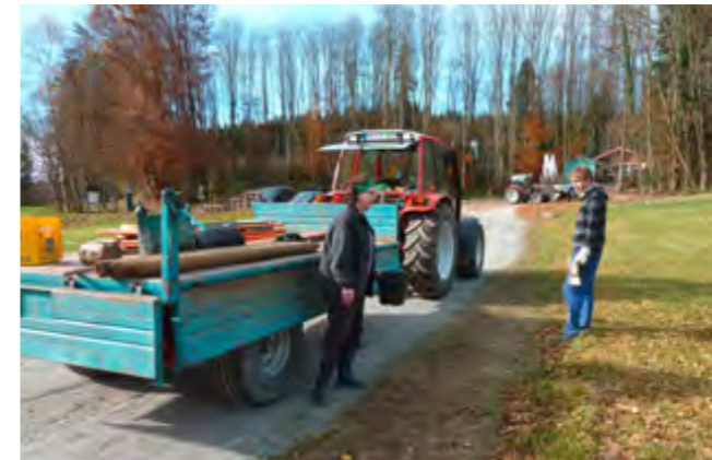
Landwirte stellten ihre Traktoren und Gerätschaften zur Verfügung.