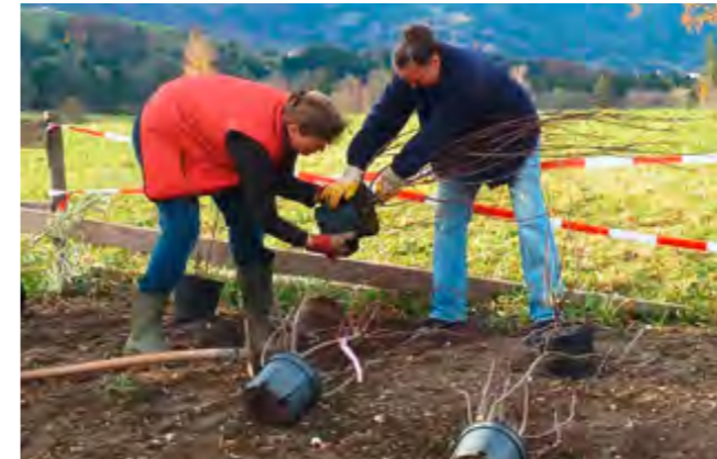
Alle sind stolz auf das große Engagement aus den eigenen Reihen: Bei der Pflanzaktion war viel Tatkraft gefragt.

entstand ein Schwimmteich, dessen hervorragende Wasserqualität mit Hilfe einer Natur-Kies-Filteranlage samt nachgeschalteter Pflanzenkläranlage gesichert werden konnte. Verschmutztes Wasser wird durch dieses praktisch vollbiologische System gepumpt und kommt völlig sauber wieder zurück.