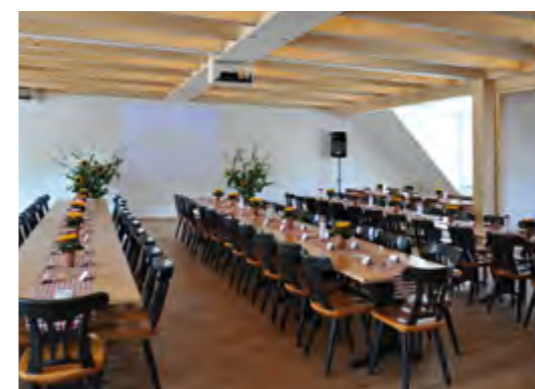
Im Seminarraum im Obergeschoss finden 70 Personen Platz.

Und das Ganze wurde gleich von Anfang an als eine Schaukäserei konzipiert, die erste dieser Art in Nordschwaben. So etwas gab es bislang nur in touristischen Regionen, wie zum Beispiel beim Kloster Ettal oder auch im Allgäu. Durch große Fenster können Kunden und Besucher zuschauen wie aus der Milch die verschiedensten Käsesorten produziert werden. Eine Treppe führt ins Obergeschoss, wo in einem Veranstaltungsraum Käseverkostungen, Verbraucherseminare und Schulungen für Käse-Fachpersonal abgehalten werden können. Dabei wird auch an Besuchergruppen aus der Umgebung gedacht.