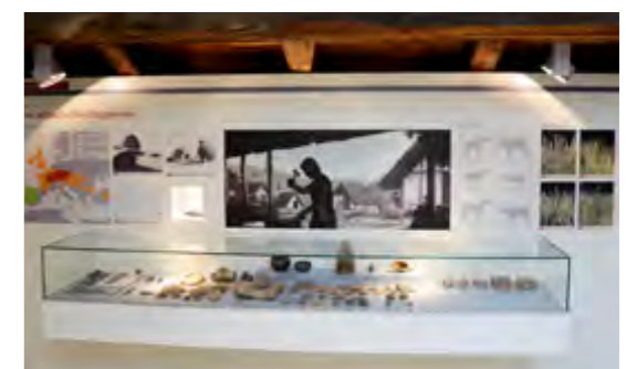
Schmied in einem keltischen Dorf bei der Arbeit. So ähnlich könnte es ausgesehen haben.