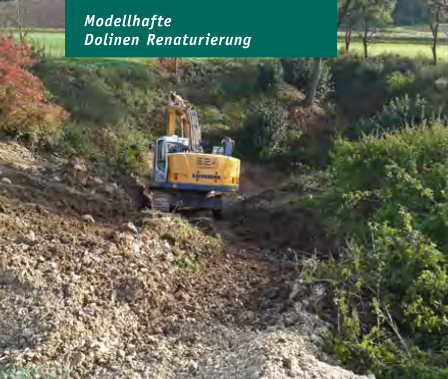
Im steilen Gelände der Doline Otterzhofen bei Riedenburg muss der Bagger Schwerstarbeit leisten.