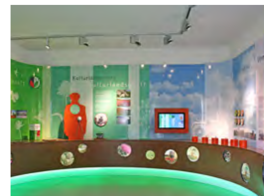
Der Aktionspavillon in Schwebheim lädt zum Entdecken und Erleben der einmaligen Kräuterlandschaft mit allen Sinnen ein.

Fünf gemeinschaftliche Ziele haben sich dabei herauskristallisiert: die Stärkung des örtlichen Selbstbildes, die Profilierung der Wahrnehmung von außen, die Hebung des Freizeitwertes der landwirtschaftlich genutzten Fluren, die Unterstützung der lokalen Betriebe und schließlich auch die Förderung der Biodiversität sowie des Artenschutzes. Zentrale Anlaufstelle in jeder Gemeinde ist dafür ein Info-Pavillon mit Sitzgele-