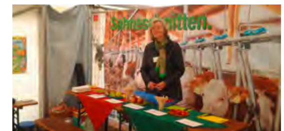
Zum Schmecken lernen gehört auch Theorie.

Beratung bei der Projektentwicklung und Konzeption, Förderabwicklung