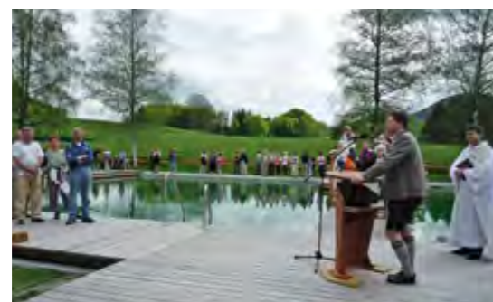
Unterhaltsames Einweihungsfest mit kirchlichem Segen.

Die Filze in der Talmulde des Steinbachs zwischen Törwang und Grainbach ist ein beliebtes Naherholungsgebiet in einer grünen Kulturlandschaft mit Feucht- und Nasswiesen und Niedermooren. Mit dem Projekt „Erlebnis Samerberger Filze“ wurde nun dieser besondere Naturraum zu einem naturnahen Erholungsgebiet weiterentwickelt, wobei aber nicht nur dem Naturschutz, sondern auch der Landwirtschaft Rechnung getragen wurde. Der größte Brocken war die Neukonzeption des alten Filzenbades, das in den 60er Jahren in die Landschaft betoniert worden war. Bagger rückten an und brachen einen Teil der Betonumfassung ab. Mit Hilfe einer Folie