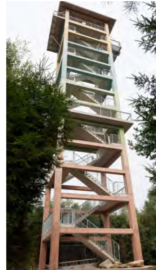
Ebenso luftig und mit guter Fernsicht: Vom 30 Meter hohen Aussichtsturm geht der Blick bis zu den Alpen.

Der Wildpark war immer schon Anziehungspunkt: Er beherbergt eine Vielzahl verschiedenster Tiere vom Hängebauchschwein bis zu Greifvögeln, einen Waldseilgarten, diverse Kinderspielgeräte, sogar eine Sternwarte und natürlich auch eine