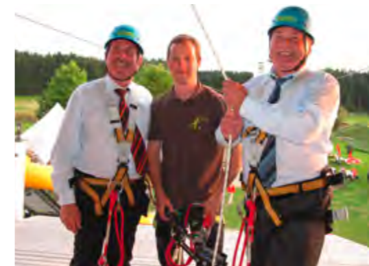
Spontane Aktion bei der Einweihung: Minister Helmut Brunner und Landrat Georg Huber gehen mit gutem Beispiel voran.

Gastronomie. Flying Fox und Aussichtsturm machen den Besuch noch reizvoller. Bei der Einweihungsfeier für den Flying Fox und den Turm, zu der auch Landwirtschaftsminister Helmut Brunner angereist war, betonte Landrat Georg Huber die überregionale Bedeutung dieser Einrichtung, die zugleich auch eine wichtige weitere Einkommensquelle für die Landwirte sei. Minister Brunner wiederum staunte über die stürmische Entwicklung, die das Projekt seit seinen Anfängen vor zehn Jahren genommen hat. Die Fläche wuchs von 10 auf 15 Hektar, die Besucherzahl habe sich auf 120 000 verdreifacht, darunter 40 Prozent Kinder, und auch die Anzahl der Beschäftigten sei kräftig angewachsen. Er nannte die neue Anlage in Anspielung auf den hohen Turm