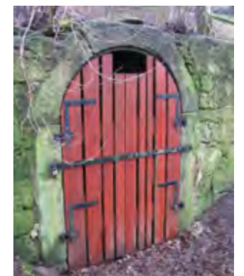
Kellertür mit Fledermausanflugloch.