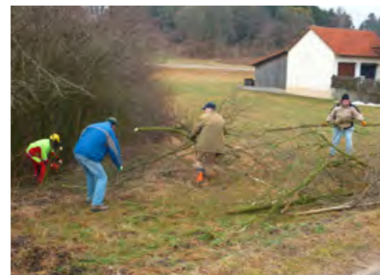
Ohne aktive Bürgerbeteiligung nicht machbar!

Dolinen sind Spalten, kraterartige Bodeneinbrüche, die durch Erosion im Kalkgestein entstehen, wenn Regen und Schmelzwasser die Mineralien im Gestein lösen und ausspülen. Häufig anzutreffen sind sie im Karst des Jura, insbesondere rund um Riedenburg, Beilngries, Breitenbrunn und Dietfurt. Weil diese geologischen Besonderheiten gleichsam eine direkte Verbindung zwischen der Bodenoberfläche und dem Grundwasserstrom darstellen, gelten sie als neuralgische Stellen für den Schutz des Trinkwassers, denn mit dem ungefilterten Abfluss von der Oberfläche werden oft Dünger oder Pflanzenschutzmittel aus der