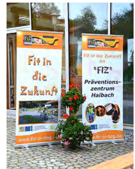
Der Name ist Programm: Fit in die Zukunft.

Beratung bei der Projektentwicklung und Konzeption, Förderabwicklung