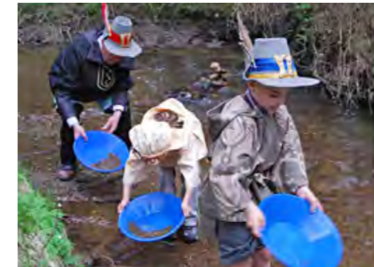
Echte Suche nach echtem Gold in echten Kostümen!

Unterstützt mit einem kräftigen Zuschuss aus dem Leader-Programm ist ein Gold-Lehrpfad angelegt worden, der auf drei verschiedenen Routen zum Wandern einlädt. Die Wege sind maximal 4 Kilometer lang und führen entlang der heute noch reichlich vorhandenen historischen Spuren des mittelalterlichen Goldabbaus. Ausgangspunkt für die Wanderungen ist die Info-Stelle bei „Gütting“, südöstlich von Unterlangau, 8,5 Kilometer von Oberviechtach entfernt, wo die Geschichte des Goldabbaus mit Schautafeln anschaulich dargestellt wird.