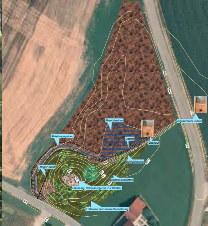
Ein genauer Plan für alle notwendigen Maßnahmen stand am Beginn der Arbeiten.