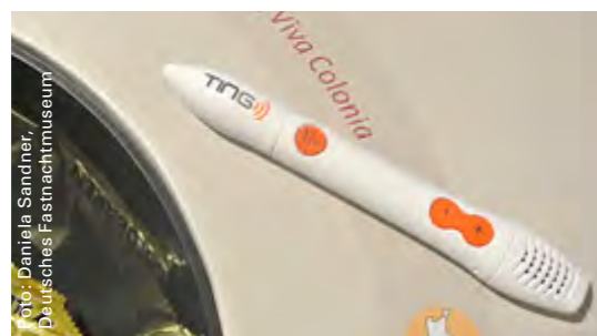
Der Hörstift eröffnet neue Möglichkeiten im Bereich des musealen Audioguides.

Möglich gemacht hat dies unter anderem auch eine großzügige Zuwendung aus dem Leader-Projekt, mit der ein Teil der neuen Inneneinrichtung finanziert wurde. Notwendig wurden die Aus- und Umbaumaßnahmen, weil in den bisherigen Räumen der Brandschutz nicht mehr gewährleistet war. So nutzte man die Chance, die Ausstellungs- und Veranstaltungsflächen mit einem Neubau zu ergänzen und nach modernster Museumsdidaktik zu gestalten.