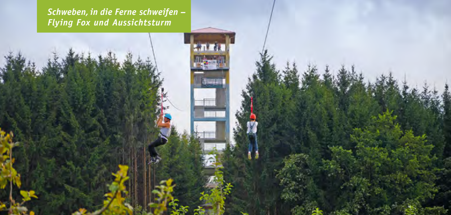
Wagemutige Besucher können an stählernen Seilen 400 Meter weit über das ganze Gelände hinwegfahren.