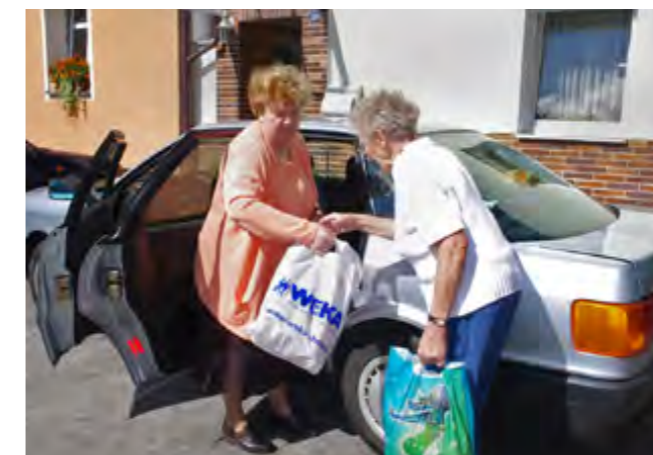
Große Entlastung: Der Einkauf wird direkt an die Tür gebracht.

Mit den Zuschüssen der Europäischen Union über das Leader-Programm wird vor allem ein Netzwerkmanagement für die Seniorengemeinschaft eingerichtet mit einer Spezialsoftware zum Aufbau eines Tauschrings, der die Generationen übergreift und verbindet. Dazu gehört auch eine Vollzeitkraft für die Dauer von zunächst drei Jahren.