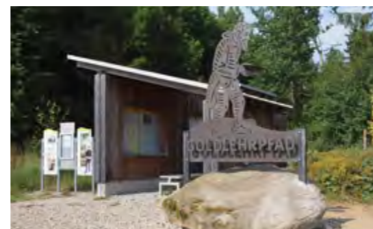
Info-Tafeln am Ausgangspunkt des Goldlehrpfades erläutern die Geschichte des Goldabbaus.

Wenn sich auch die Ausbeute im großen Stil nicht lohnt, so führen die Bäche rund um Unterlangau heutzutage doch immerhin noch so viel Gold, dass die Idee entstand, mit einem touristischen Angebot daran anzuknüpfen.