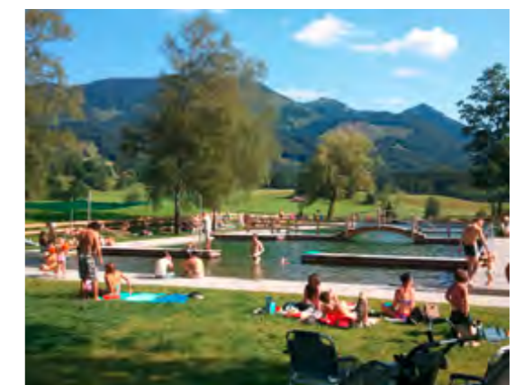
Oberbayerische Bergidylle: So macht Baden Spaß!

begehbar wurde. Eine dieser Wegeschleifen ist als Barfußweg ausgestaltet. Jeder Abschnitt des Filzenrundweges gilt einem besonderen Thema. Dazu gehören die geologische Entstehung des Samerberg, die Veränderungen, die der Mensch der Natur zugefügt hat sowie ein Weg der Sinne, wo Kinder die Natur sehen, hören, fühlen, riechen und schmecken lernen. Letzteres dient der nahe gelegenen Grundschule gleichsam als „Klassenzimmer im Grünen“ für die Fächer Heimat- und Sachkunde.