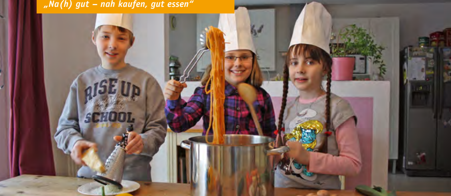
Kochen lernen macht Spaß – nicht nur wegen der schicken Kochmützen.