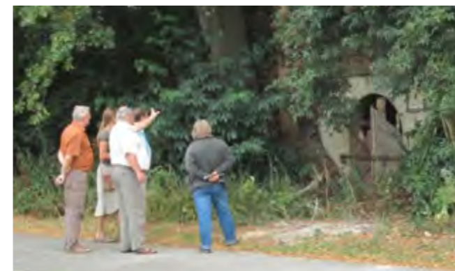
Oft bleiben Felsenkeller aus Sicherheitsgründen ungenutzt.

Viele dieser übermannshohen Felsenkeller wurden mühselig über Jahre aus dem weichen Sandstein geschlagen und bilden ein verzweigtes Labyrinth von Gängen. Noch komplexer sind oft die Eigentumsverhältnisse und Nutzungsrechte, die über Generationen vererbt wurden und nur selten schriftlich niedergelegt sind. Nur noch wenige Experten und alteingesessene „Kellerrechtler“ kennen sich damit aus. Kein Wunder, denn zum Beispiel am Voggen-dorfer Kellerberg gruppieren sich fast 30 verschiedene Kellereingänge um einen der gern besuchten