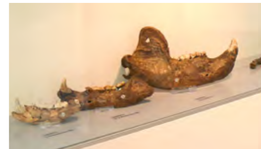
Knochen von mehr als 140 Tierarten konnten die Archäologen identifizieren, darunter Bären, Löwen und Nashörner.