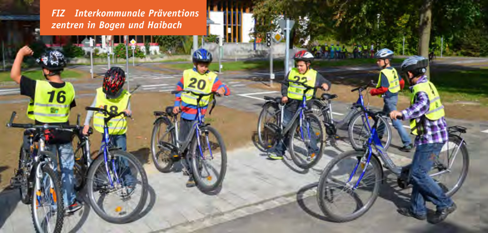
Mit Kindern und Jugendlichen wird regelmäßig das richtige Verhalten im Straßenverkehr eingeübt.