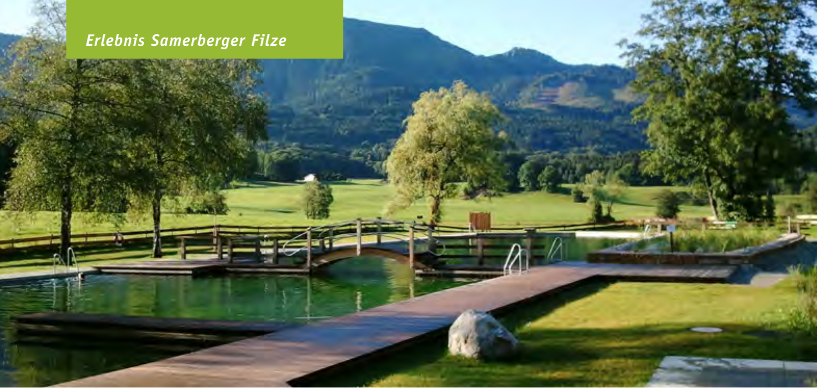
Ein echtes Schmuckstück dank Leader und vielen Helferhänden: Das neue Naturbad im malerischen Chiemsee-Alpenland.