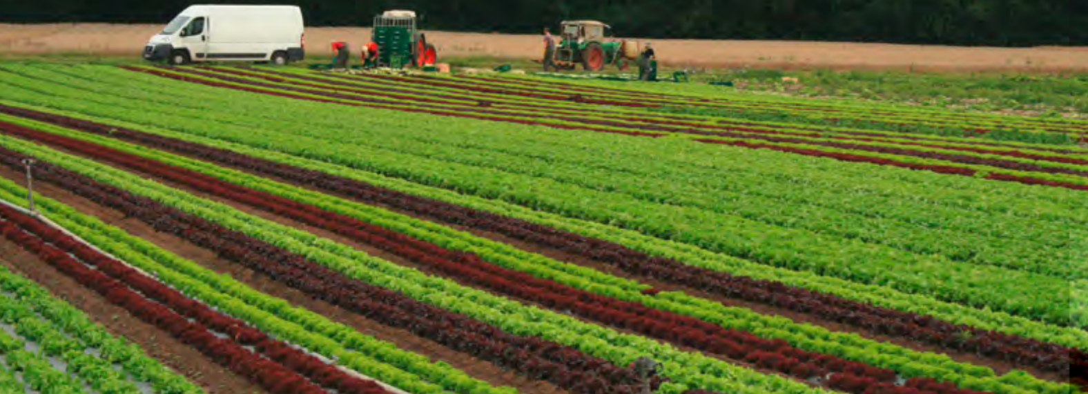
Salatköpfe in Reih und Glied, farblich bunt gemischt.