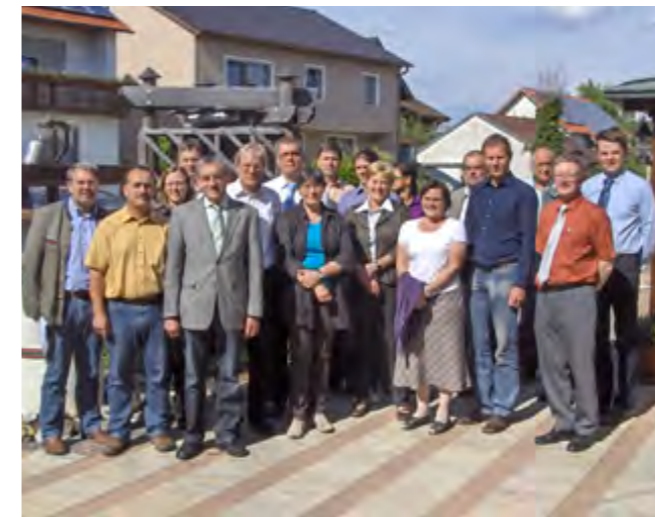
Alle Fachbehörden in einem Boot: Beim gemeinsamen Termin wurden die Zuständigkeiten geklärt und das weitere Vorgehen festgelegt.

Landwirtschaft eingeschwemmt. Ein weiteres Problem besteht darin, dass sich im Laufe der Zeit auch Lehm und Sand in den Dolinen so stark ansammeln, dass sie „dichtmachen“, kleine Gewässer bilden und z. B. bei der Schneeschmelze Überschwemmungen auslösen können.