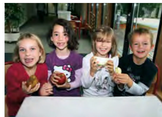
Kinder lernen Obst und Gemüse kennen und schmecken.

Ein weiterer Baustein des Projekts sind Betriebsbesuche. Die Kinder sollen die Direktvermarkter und deren Produkte in ihrer Umgebung ebenso kennen lernen wie die Herstellung auf dem Bauernhof und die kurzen Transportwege bis zum Verbraucher. Thematisiert wird dabei auch der